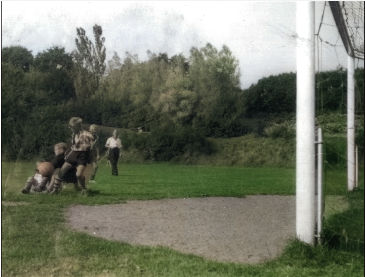
Billedet på forsiden er banen i Glamsdalen og fra 1950'erne.